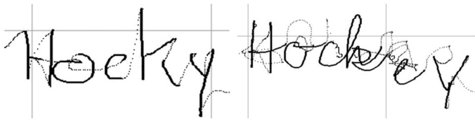
Abb. 1 Zwei Aufnahmen mit CSWin aus dem 4. Schuljahr (die Bewegung auf dem Papier wird als durchgezogene Linie dargestellt, die Bewegung in der Luft als gepunktete Linie)

staben nicht nur beurteilt werden kann, wenn sie auf dem Papier realisiert sind, sondern auch in der Luft: